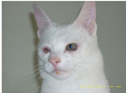
Fonsi direkt nach der rettenden Operation

starken Schnupfen und bekam die Augen vor lauter Eiter nicht mehr auf. Bei der Untersuchung stellten wir fest, dass der kleine Kerl komplett taub war, was für eine Katze doch eine starke Behinderung ist. Zu allem Übel drohte dem Katerchen noch das Erblinden. Das war den Besitzern zu viel –