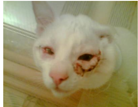
Stark entzündete Augen – die reinste Qual

Das Leben ist nicht fair – und das ist auch gut so. Würden wir alle im Tal der Glückseligen leben, dann wäre wohl jeder Tag von Langeweile geprägt, und keiner wüsste es zu schätzen, wie gut wir es eigentlich alle haben. Oft muss man schlimme Zeiten durchstehen, um zu merken, auf wen man wirklich zählen kann. Nur rauer Gegenwind trennt die Spreu vom Weizen. Und das zeigt sich auch in den kleinen Geschichten, die die Praxis für uns bereit hält: Eines Tages brachte ein Kunde seinen kleinen weißen Kater zur Sprechstunde. Der Kleine hatte