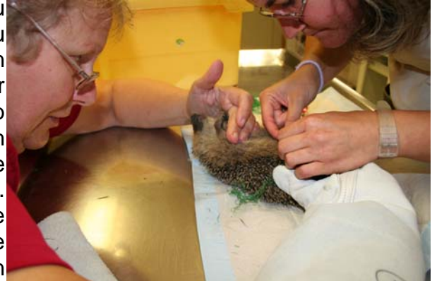
Der Igel wird mühsam von seinen Fesseln befreit.

„Ein Haus muss sauber genug sein, um gesund zu bleiben, und unordentlich genug, um sich wohl zu fühlen.“ Dieser Spruch gilt natürlich auch für den Garten, und gerade die Wildtiere freuen sich über ein bißchen Unordnung im Garten. Egal, ob Gartenrotschwänzchen, Siebenschläfer oder auch die Igel. Klinisch saubere Gärten bieten keine Verstecke, keine Jagdgründe, keinen Spass. Allerdings können manche Dinge auch für unsere kleinen Freunde schnell gefährlich werden. Wie z.B. Vogelnetze. Eigentlich sollen sie Vögel von den Kirschen fern halten, aber einem kleinen Igel können die engen Maschen eines am